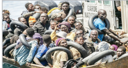
کشف یک قایق پر از پناجویان آفریقایی عازم اروپا