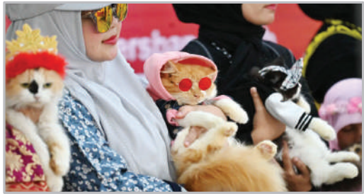
جشنواره گربه های خانگی - آچه انونوزی