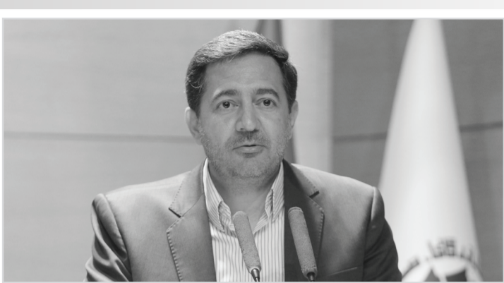
رئیس هیئت مدیره شرکت

وی با تأکید بر اینکه نگاهش بهره‌گیری از ظرفیت خبرنگاران برای تبیین وضع موجود و اینکه برای آینده چه اقداماتی باید انجام دهیم، است؛ اظهار کرد: بعضاً با یک سری محدودیت‌ها مواجه هستیم، به‌ طور مثال در بحث محدودیت‌های مالی و بودجه امسال حدود سه هزار و ۳۰۰ میلیاردتومان نیاز تسهیلاتی تبصره ۱۸ داریم اما با تمام حمایت‌هایی که می‌شود، سهمی که اختصاص می‌یابد به استان جوابگوی بسیاری از مقاضیان نیست.