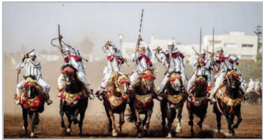
سوارکاری و تیراندازی در جشنواره ای سنتی - شهر ریاط مراکش