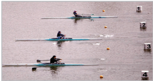
مسابقات قایقرانی روئینگ بانوان در دریاچه آزادی - تهران