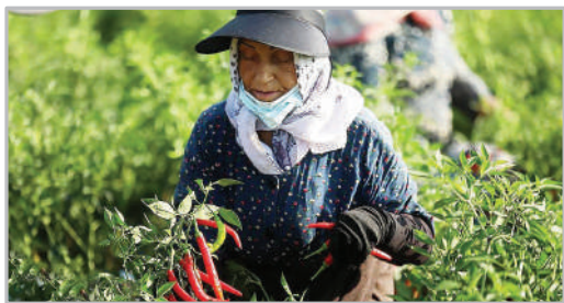
برداشت محصول لفل - مازندران