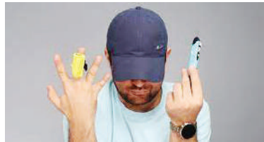
دستکاری عجیب برای داماد روحانی در آزمون خلبانی

کلیپ ماوس، باتری لیتیوم یونی دارد و با کابل یو اس بی‌شارژ می‌شود. یک بار شارژ آن برای ۵۰ ساعت استفاده کافی است.