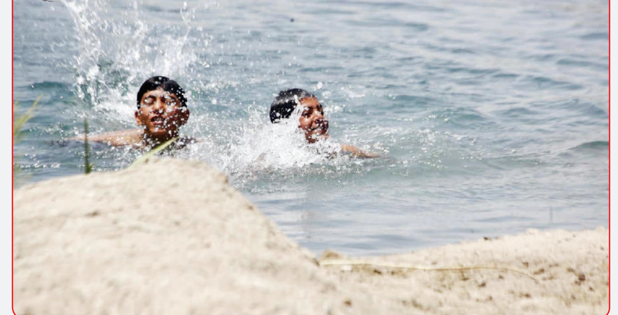
آب‌تنی در روزهای گرم تابستان